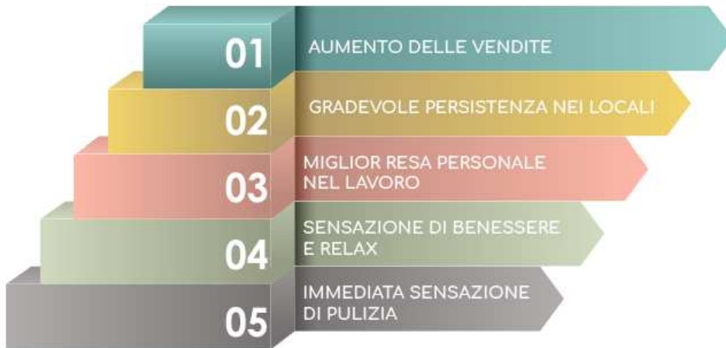
GRAFICO DEI BENEFICI E RESA RISPETTO AL MARKETING OLFATTIVO

Il Marketing Olfattivo ricade nell'ambito di applicazione del Marketing Sensoriale, che studia e utilizza l'enorme potenziale dei profumi come mezzo di comunicazione. Esso si basa sul coinvolgimento di uno dei 5 sensi, l'olfatto. Grazie alla diffusione di particolari fragranze studiate si